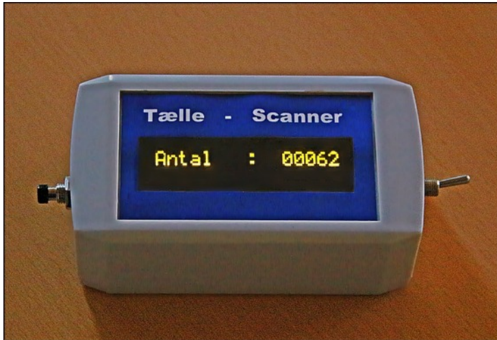
Scanner til optisk aflæsning af tæller.

Scanner til elektronisk aflæsning af tæller. Scanneren holdes hen foran modtageren og antallet overføres automatisk til scannerens display. Scanneren kan også bruges til at nulstille tælleren, men de fleste vælger blot at tælle videre. Den optisk aflæsning er den optimale løsning på at gøre systemet diskret og vandtæt. Ingen kabler og ingen stik der skal tilkobles. Man behøver bare en scanner da den kan anvendes til alle de tælle - stationer man har.