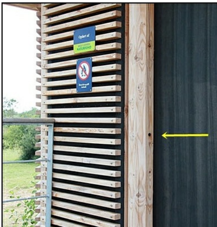
Eksempel på montage i dørkarm på et af Aage V. Jensen Naturfond's mange smukke fugletårne.

Jo hyppigere man aflæser data , jo mere detaljeret er den viden man indsamler. Der arbejdes for øjeblikket på at udvikle et system der automatisk gemmer data for hvert døgn. Det kan på nuværende tidspunkt ikke oplyses hvornår det er færdigt.